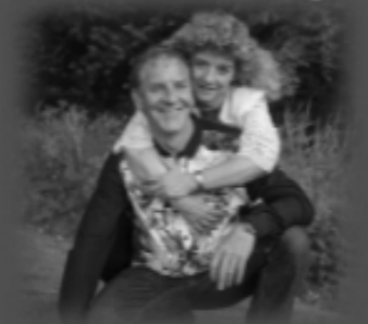
Het ijssel Duo